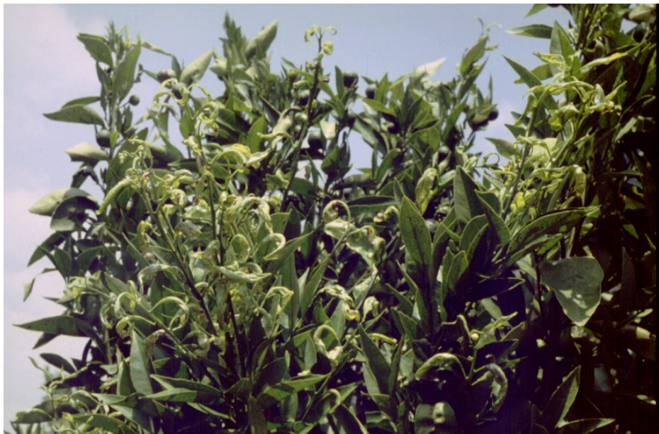
AlgarOrange Associação de Operadores de Citrinos do Algarve